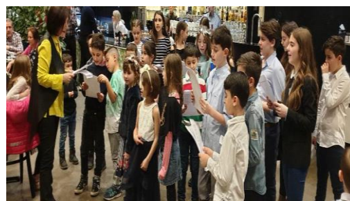
Σχολική γιορτή στο Μπορός

Μεγάλη ήταν η συμμετοχή της κοινότητας του Μπορός στη γιορτή του σχολείου. Οι μαθητές του σχολείου παρουσίασαν το χρονικό της επανάστασης, τραγούδια και ποιήματα τιμώντας τους εθνικούς μας ήρωες.