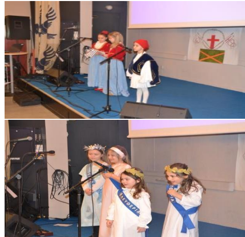
Σχολική γιορτή στο Γκέτεμποργκ