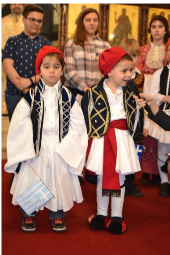
Εορτασμός 25ης Μαρτίου 1821

Είπαν, και είναι αλήθεια, πως τα άτομα και οι λαοί που χάνουν τη μνήμη τους, χάνουν μαζί και το πρόσωπό τους, αλλοτριώνονται. Γιατί η μνήμη είναι που μας κρατά ενωμένους με τις ρίζες μας. Είναι ο αγωγός μέσα από τον οποίο περνά και φθάνει στο σήμερα η εμπειρία του χθες. Και το κύλισμα του χρόνου μας δίνει συχνά κεντρίσματα για να αφουγκραστούμε τη φωνή του παρελθόντος, ένα παρελθόν που μας διδάσκει και μας εμπνέει το θαυμασμό και την εθνική υπερηφάνεια. Κάθε χρόνο αυτό τον μήνα η μνήμη μας φέρνει στην ηρωική επανάσταση του 1821.