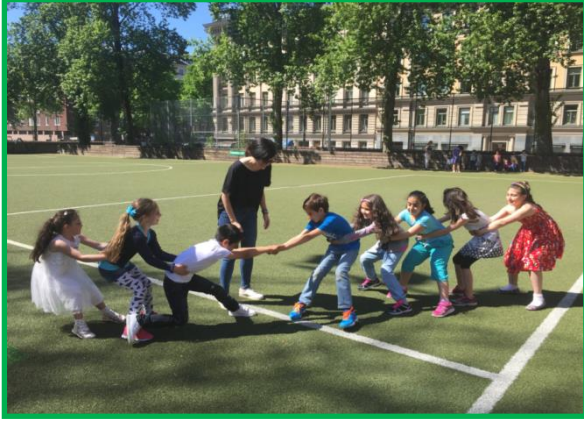
Περνά περνά η μέλισσα