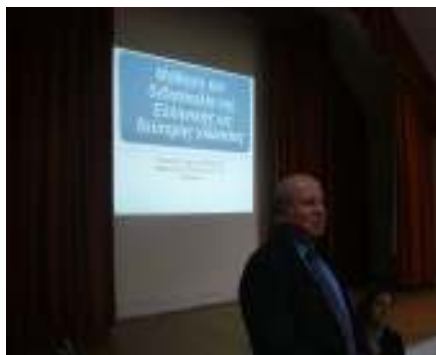
Στιγμιότυπο από το σεμινάριο